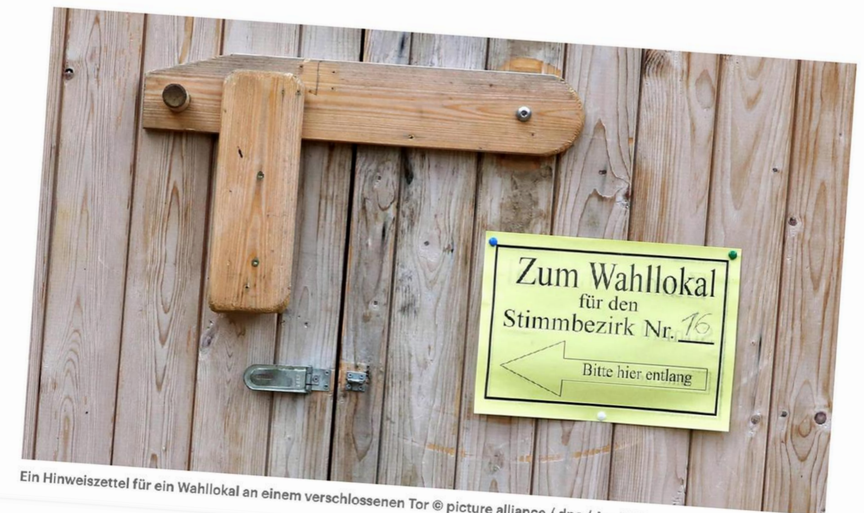
Ein Hinweiszettel für ein Wahllokal an einem verschlossenen Tor